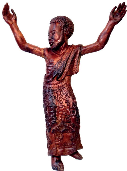
Le Christ - l'Africain victorieux. Oeuvre de James Samikwa, Centre culturel KuNgoni, Mua, Malawi.

Le Christ est le parfait sing'anga . Son incarnation, ses enseignements et le don de sa vie, dans un geste de pardon inégalé, font de lui le guérisseur cosmique par excellence.