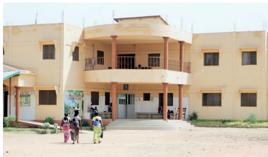
Bâtiment principal de l'association « Vivre dans l'Espérance » situé à Dapaong au Togo . Photo : Yoabone Jean, février 2020

C'est avant tout par l'espérance, par cet amour inconditionnel de la vie, puisé dans l'amour du Christ, que nous pouvons réussir à améliorer un peu le sort des plus pauvres d'entre les pauvres. »