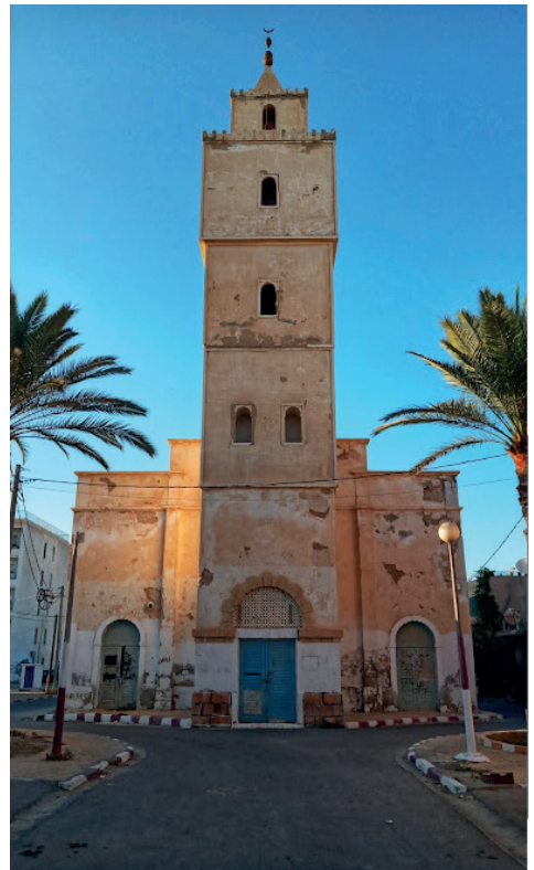
L'église de Gabès en Tunisie

Nous projetions de mettre sur pied un nouveau projet chaque dimanche après-midi. Malheureusement, cela n'a pas pu se réaliser. En effet, nous, les prêtres, devons toujours être de retour à Sfax où nous résidons avant la tombée du jour.