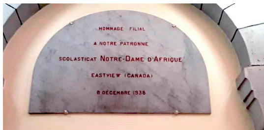
Ex-voto, 8 décembre 1938.

chrétiens et musulmans. C'est dans cet esprit que nous nous engageons à nous unir, même à distance, aux célébrations entourant la programmation des événements soulignant le 150 e anniversaire de la basilique.